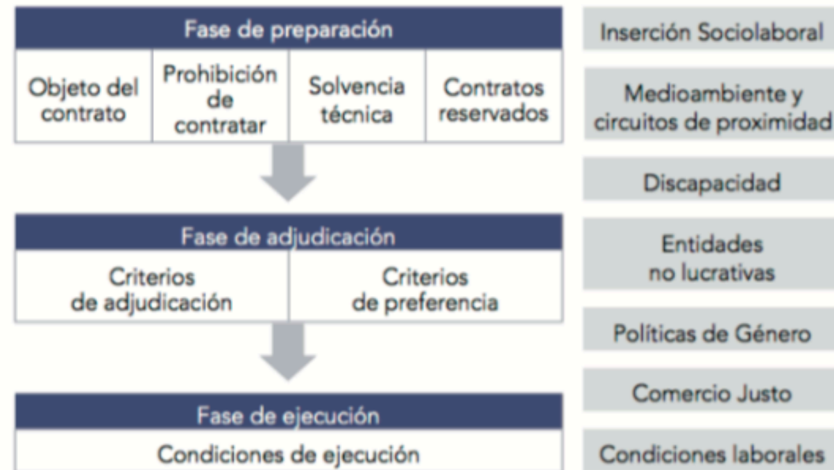
Figura 1. Clàusules socials: tipus i fases per a la seva introducció.